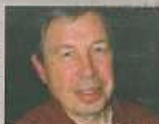
Il a imaginé la nouvelle Grand'Place de Hannut.

> Le travail a-t-il été officiel? Je me suis lancé dans l'aventure